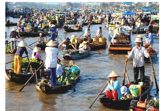
Hoang Hai Long hotel***

Déjeuner au restaurant. Retour à Saigon. Nuit à Saigon.